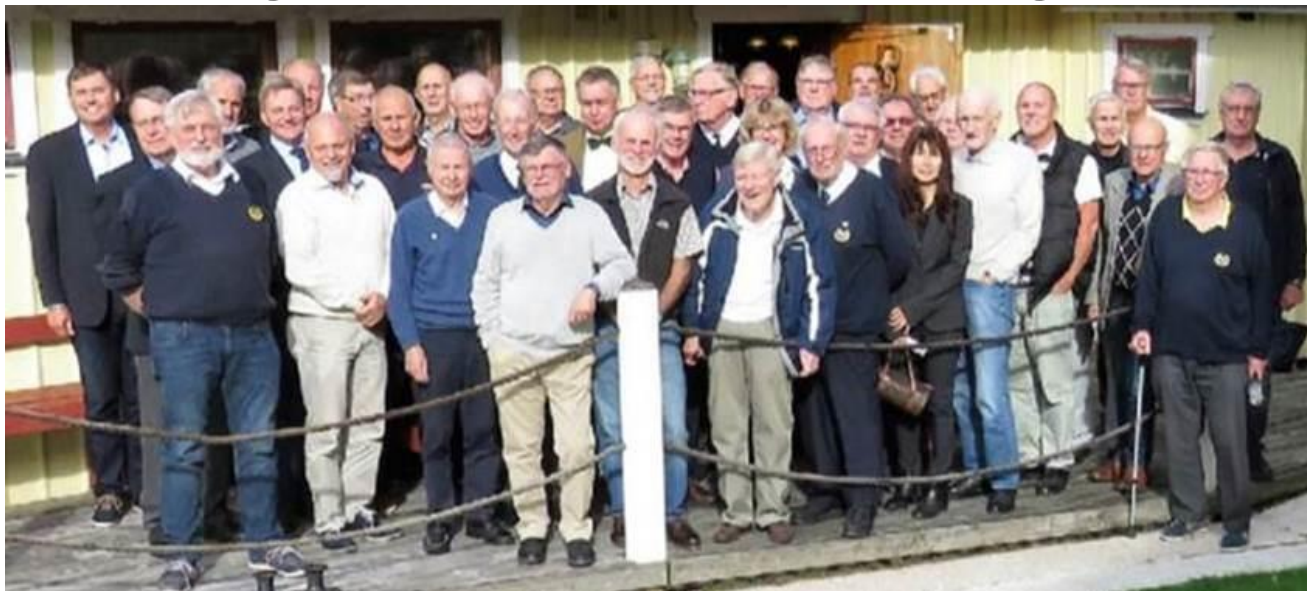
Ett foto från regionmöte väst före Covid-19 tiderna