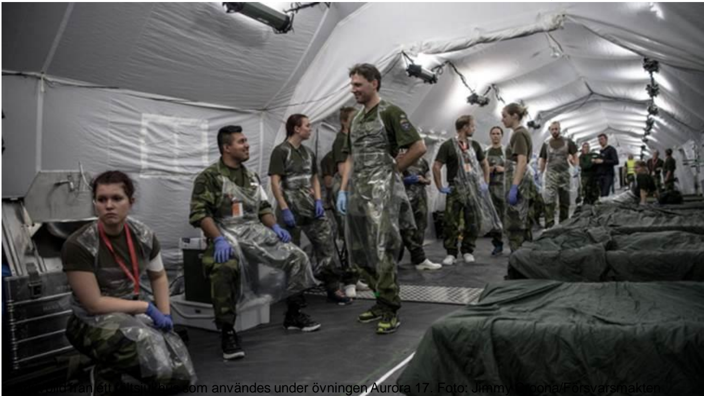
En del av ett fältsjukhus som användes under övningen Aurora 17.

Överbefälhavaren har beordrat Försvarmakten att upprätta ett fältsjukhus på Ärna flygbas i Uppsala.